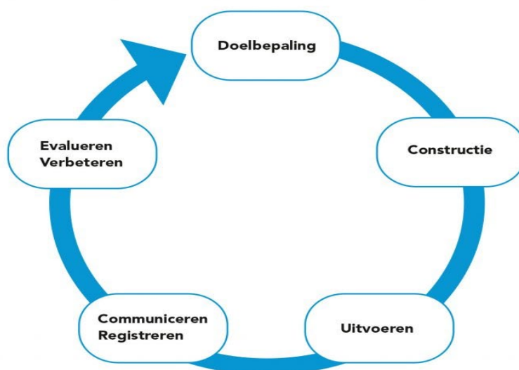
Figuur 3 Toetscyclus

Naast een inhoudelijke component – de witte driehoek in het midden van de piramide – is er nog het totstandkomingsproces van toetsen: de eerste (lichtblauwe) rand om de witte driehoek. Ook dit proces, in het bijzonder toetsen voor het schoolexamen, moet zorgvuldig zijn en bijdragen aan een voortdurende kwaliteitsverhoging. Met een zorgvuldige procedure rondom elke toets blijft de kwaliteit van de toetsing in de aandacht van de school. In verband met de relatie met diplomering moet de totstandkoming met voldoende waarborgen omgeven zijn. Daartoe wordt voor elke toets onderstaande cyclus doorlopen in de vakgroep – of cluster van vakgroepen: