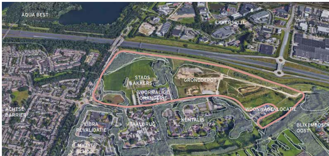
Figuur 2 – Plangebied met rood omlijnd

De haalbaarheidsfase is in augustus 2020 positief afgesloten en inmiddels heeft het college van Burgemeester en Wethouders en de gemeenteraad van de Gemeente Eindhoven ingestemd met het plan, het realiseren van circa 670 tijdelijke woningen in een parkachtige omgeving. De ‘tijdelijke’ woningen kunnen circa 30 jaar op deze locatie blijven staan. Het plangebied wordt door de Gemeente bouw- en woonrijp gemaakt.