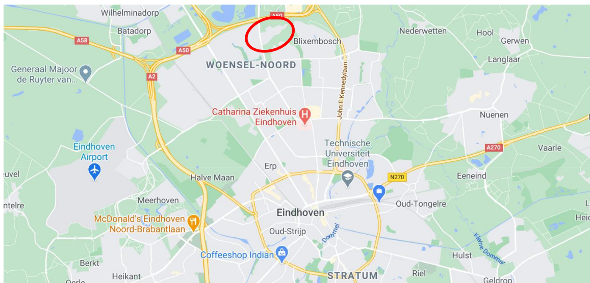
Figuur 1 – situering locatie met rood omlijnt

In 2019 zijn de Gemeente Eindhoven en de woningbouwcorporaties Woonbedrijf en 'thuis gestart met een haalbaarheidsstudie naar een gebiedsontwikkeling op de locatie 'Castiliëlaan' zie figuur 1. De locatie wordt aan de noordzijde begrensd door de A50, aan de oostzijde door de aanwezige woonwagenlocatie/ Blixembosch Oost en aan de zuidzijde door de Castiliëlaan. De begrenzing van de westzijde van de locatie is de Huizingalaan/ Achtse Barrier, zie figuur 2. Zie voor het plangebied ook bijlage 3.