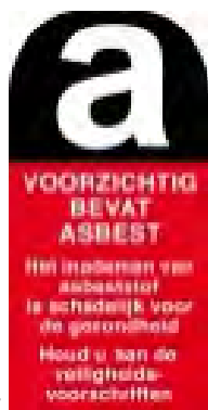
Voorbeeld van sticker