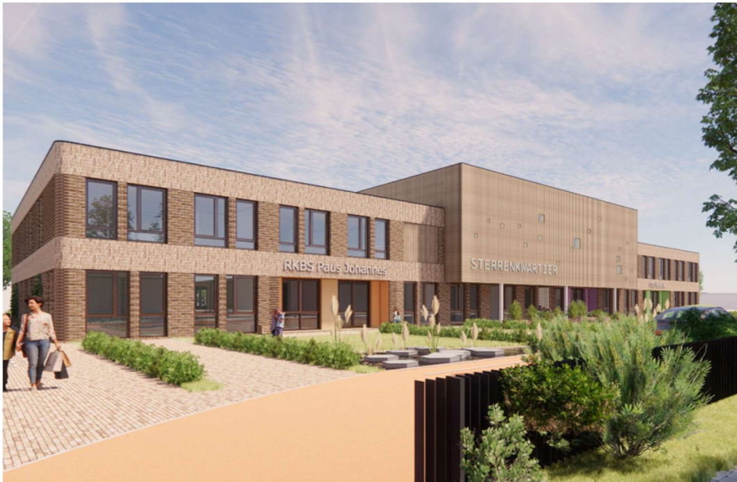
Figuur 1: impressie gevelbeeld