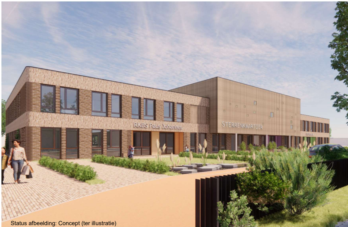
Status afbeelding: Concept (ter illustratie)

Oprachtgever Gemeente Nissewaard Project Nieuwbouw Sterrenkwartier Datum 26 mei 2021 Referentie 1630606-0096.0.5