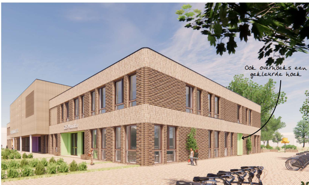
Figuur 2: impressie gevelbeeld