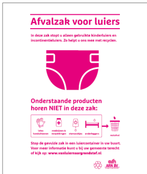
Type A: 50x70 cm