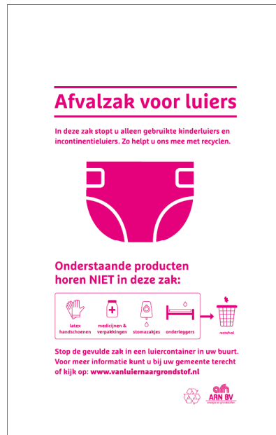
Type C: 70x120 cm