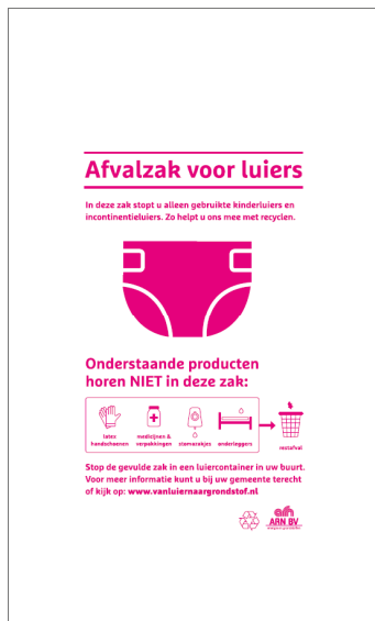
Type B: 60x110 cm