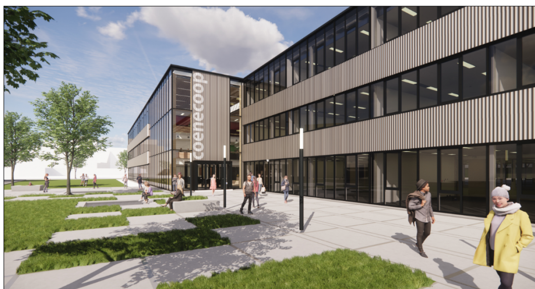
Figuur 2 Render van het exterieur. Bestek kan afwijken van dit sfeerbeeld en aan dit beeld kunnen geen rechten worden ontleend.