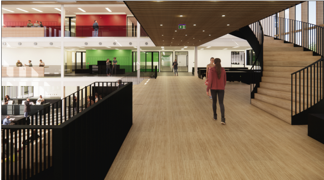
Figuur 3 Render van het interieur. Bestek kan afwijken van dit sfeerbeeld en aan dit beeld kunnen geen rechten worden ontleend.