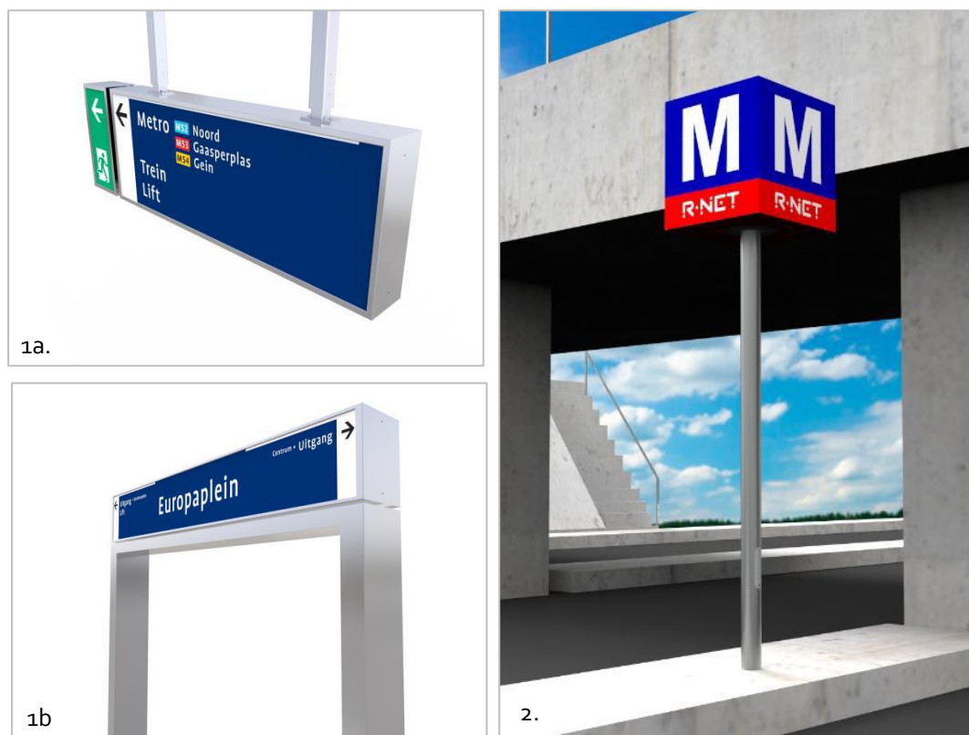
Figuur 1 (1a en 1b) beeld van bewegwijzering, (2) beeld van Kubus

Deze elementen zijn hieronder, indicatief, visueel weergegeven: