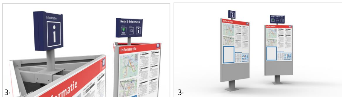
Figuur 5 (3.) beeld van informatie-i