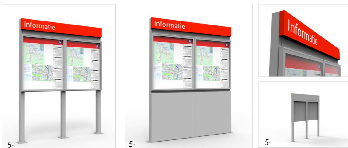
Figuur 4 (5.) beeld van clusteringspaneel/ informatiecluster

Daarnaast staan in onderliggend document de algemene eisen ten aanzien van de constructie, verlichting, elektrische installatie en levensduur omschreven.