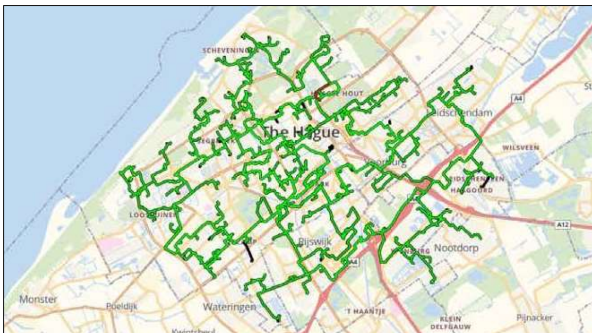
figuur 1: overzicht ligging netwerk GlasLokaal

In 2005 is door een aantal grotere onderwijsinstellingen in de Den Haag in samenwerking met de gemeente een glasvezelnetwerk aangelegd t.b.v. de Internetvoorziening voor onderwijslocaties in Den Haag, Leidschendam/Voorburg en Rijswijk. In de loop der jaren is de dienstverlening uitgebreid en momenteel maken ook enkele zorg- en culturele instellingen gebruik van het netwerk, dat een totale lengte heeft van ca. 200 km waarvan de backbone ca. 110 km beslaat. Het netwerk is aangelegd op een diepte van 60cm en er zijn via klantkabels ca. 275 actieve locaties aangesloten, waarbij het voor 85% om onderwijslocaties gaat.