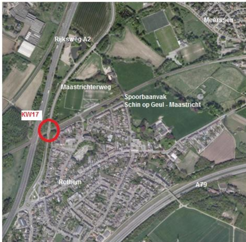
Figuur 1: Ligging KW17

Figuur 1 toont de geografische ligging van de kunstwerk KW17 - Maastrichterweg.