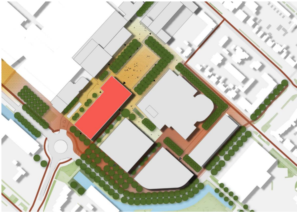
Plattegrond omgeving Raadhuisplein 2027