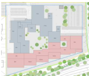
Sloop 1 ste fase (is voor start Nieuwbouw uitgevoerd)

De nieuwbouw van het Ashram College, inclusief nieuwe sportvoorzieningen, zal gerealiseerd worden op de huidige locatie, Marsdiep 289 te Alphen aan den Rijn. De huidige huisvesting heeft op dit moment een overmaat, waardoor het mogelijk is voor de school om ‘in te dikken’. Tevens zullen de sportactiviteiten tijdelijk elders worden ondergebracht (de gymzalen worden in de 1 ste fase sloop in zijn geheel verwijderd). Hierdoor is het mogelijk een flink deel van de huidige locatie te slopen en plaats te maken voor de nieuwbouw. De nieuwbouw kan zodoende in één fase worden gebouwd. Een en ander zoals onderstaand is weergegeven.