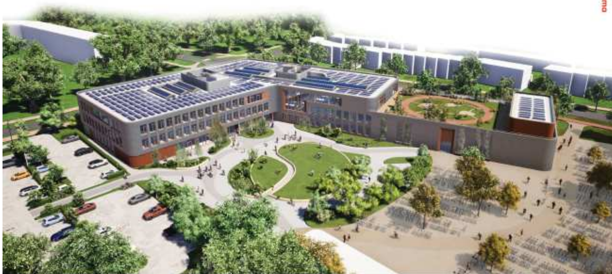
OVERZICHT VANUIT NOORDWESTHOEK

Oprachtgever SCOPE scholengroep Project Bouwprojectmanagement Ashram College Datum 17 maart 2021 Referentie 1598407-0147.3.0 Auteur(s) de heer ing. H.J.A. van den Berg