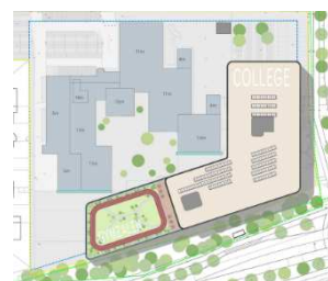
Nieuwbouw in één fase

Het Ashram College betreft een school voor mavo, havo en vwo (atheneum/gymnasium) van in totaal circa 11.791 m 2 bvo, inclusief sportvoorzieningen, voor circa 1.450 leerlingen. De 1 ste fase sloopwerkzaamheden wordt zoveel als mogelijk uitgevoerd in de schoolvakantie 2021, om overlast zoveel mogelijk te beperken. De uitvoering van de nieuwbouw vindt aansluitend plaats, naar alle waarschijnlijkheid kan er in september 2021 gestart worden met de Nieuwbouw.