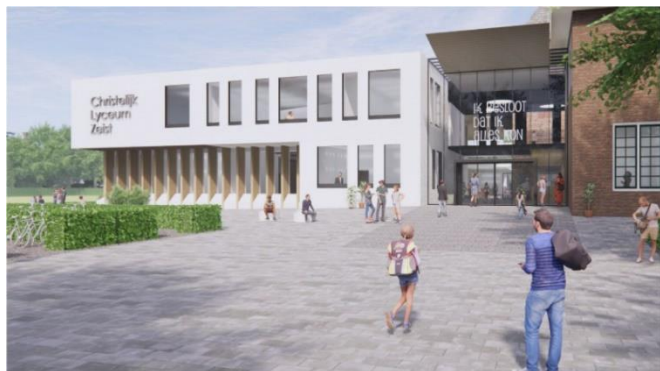
Impressie nieuwe hoofdentree Christelijk Lyceum Zeist

Het resultaat is een beter leefbaar monumentaal schoolgebouw en een 'nieuw' gebouw aan de achterzijde dat middels een luchtige binnenstraat met elkaar verbonden wordt. De nieuwe hoofdentree voor leerlingen vanaf de Verlengde Slotlaan geeft toegang tot de binnenstraat. Vanaf deze zijde krijgt het gebouw een nieuw eigen gezicht waarbij het samenspel van monument en uitbreiding goed zichtbaar is.