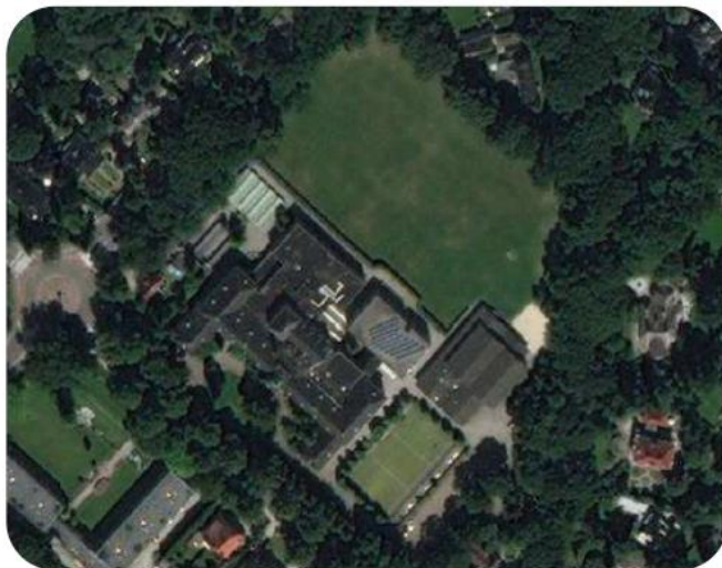
Situatie Christelijk Lyceum Zeist bestaand