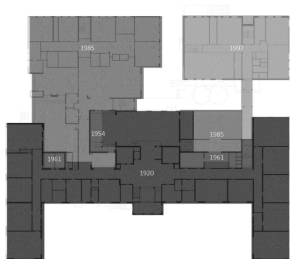
Uitbreidingen Christelijk Lyceum Zeist bestaand