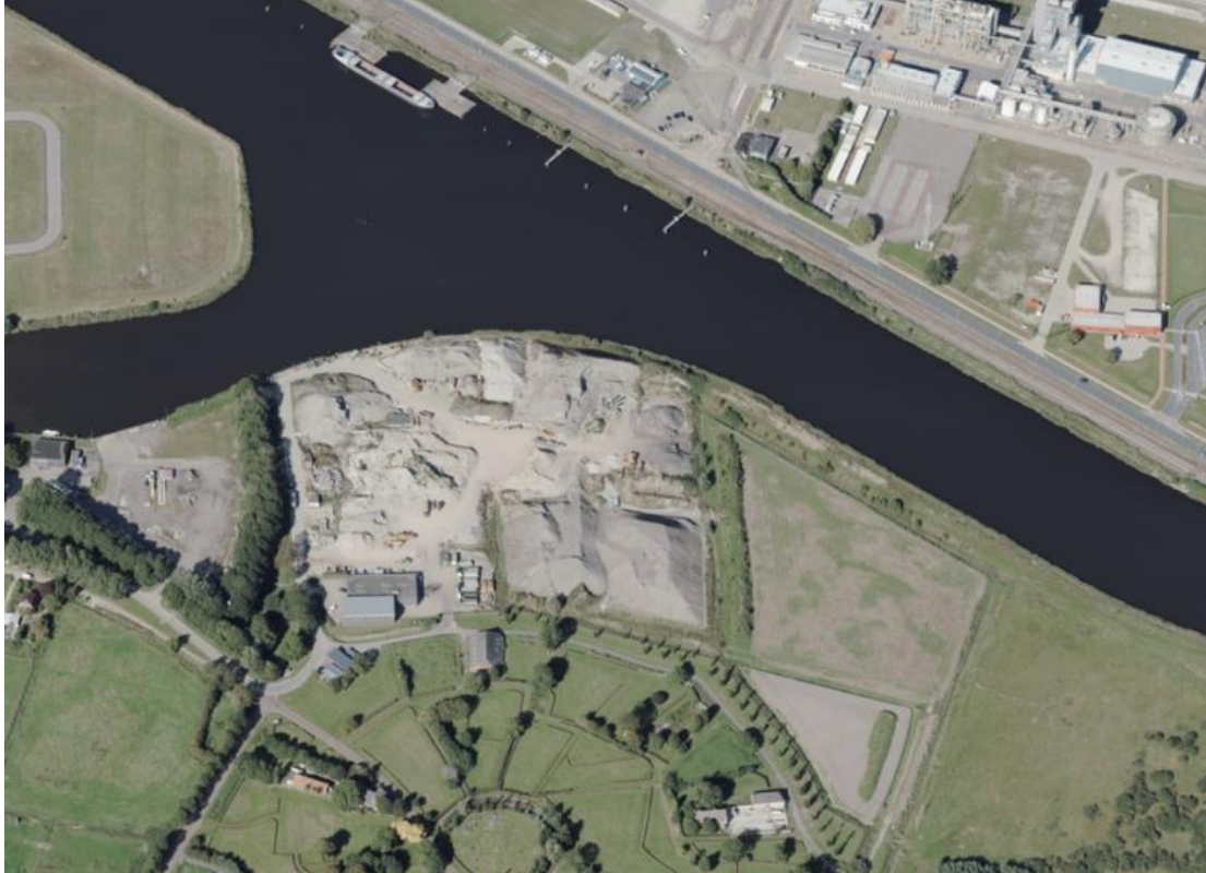
Figuur 2.1 Situatie locatie Schipper te Weiwerd (Farmsum)

Het uit te voeren werk is gelegen aan het Schaappad 3, 9936 HT te Weiwerd (Farmsum). Voor een overzicht van de locatie en de transportroute wordt verwezen naar de bijlage tekening met document nummer 15821-21.