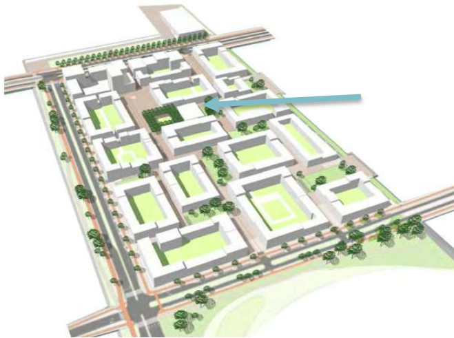
Ruimtelijkplan Centrumeiland Amsterdam

Het kindcentrum komt op het hoofdplein van het Centrumeiland: