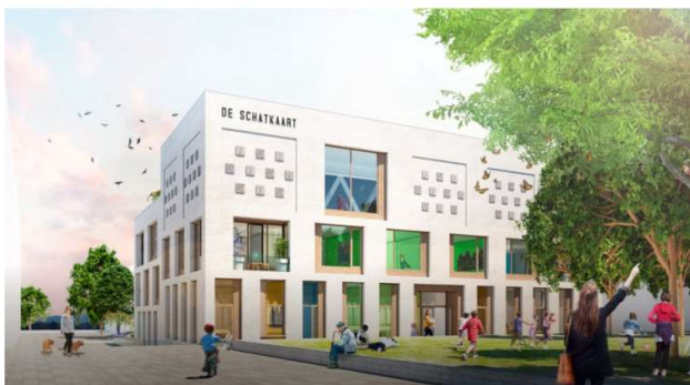
Impressie van het project

De hoofdconstructie bestaat op hoofdlijnen uit met beton gevulde stalen kolommen, stalen liggers en betonwanden. Verdiepingsvloeren en dakvloeren zijn in het algemeen opgebouwd uit kanaalplaatvloeren, met uitzondering van de dakvloer van de gymzaal (stalen dakplaten). Voor de fundering wordt vooralsnog uitgegaan van in de grond gevormde grondverdringende betonpalen met groutinjectie.