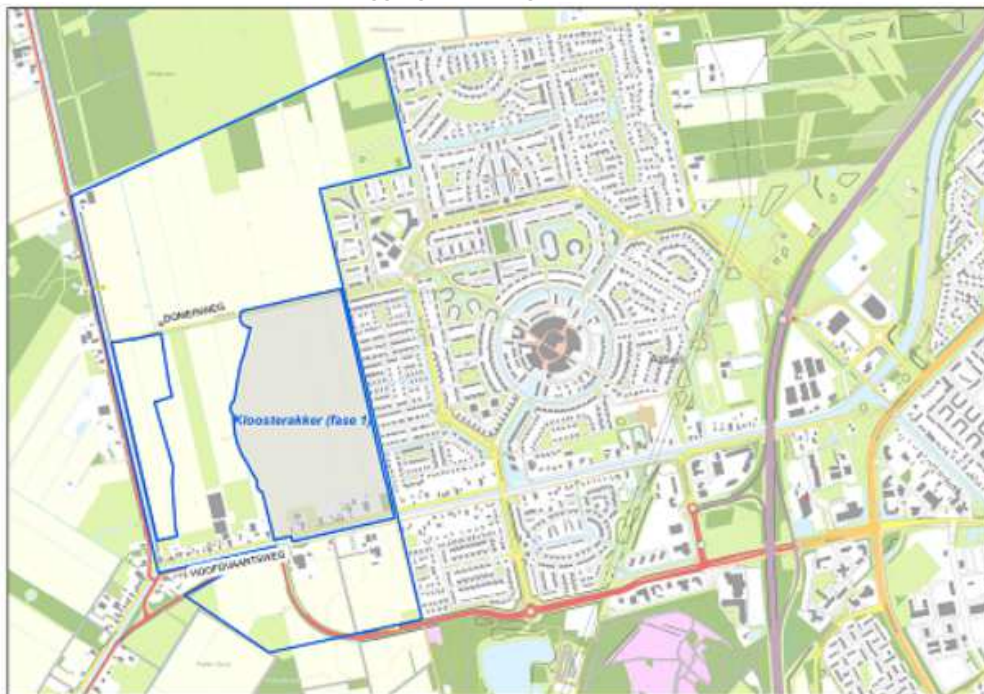
Figuur 2.1: Uitbreidingsplan Kloosterakker fase 1

Zie onderstaande kaart voor de ligging van het gebied,