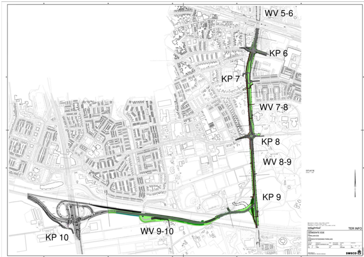
Afbeelding 2: Zuidelijk deel van de Parklaan