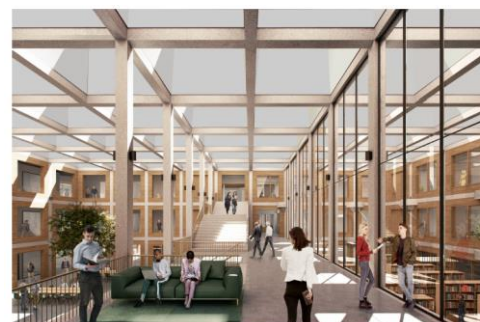
Impressie vanaf Atrium