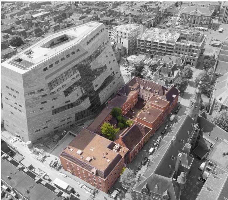
Figuur 1: in kleur geeft het bouwblok aan dat herontwikkeld wordt

Het project omvat de herontwikkeling van het bouwblok begrensd door de Sint Jansstraat, de Popkenstraat, de Schoolstraat en het Forum Groningen, zoals aangegeven in figuur 1.