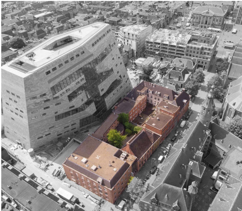
Figuur 1: in kleur geeft het bouwblok aan dat herontwikkeld wordt

Het project omvat de herontwikkeling van het bouwblok begrensd door de Sint Jansstraat, de Popkenstraat, de Schoolstraat en het Forum Groningen, zoals aangegeven in figuur 1.