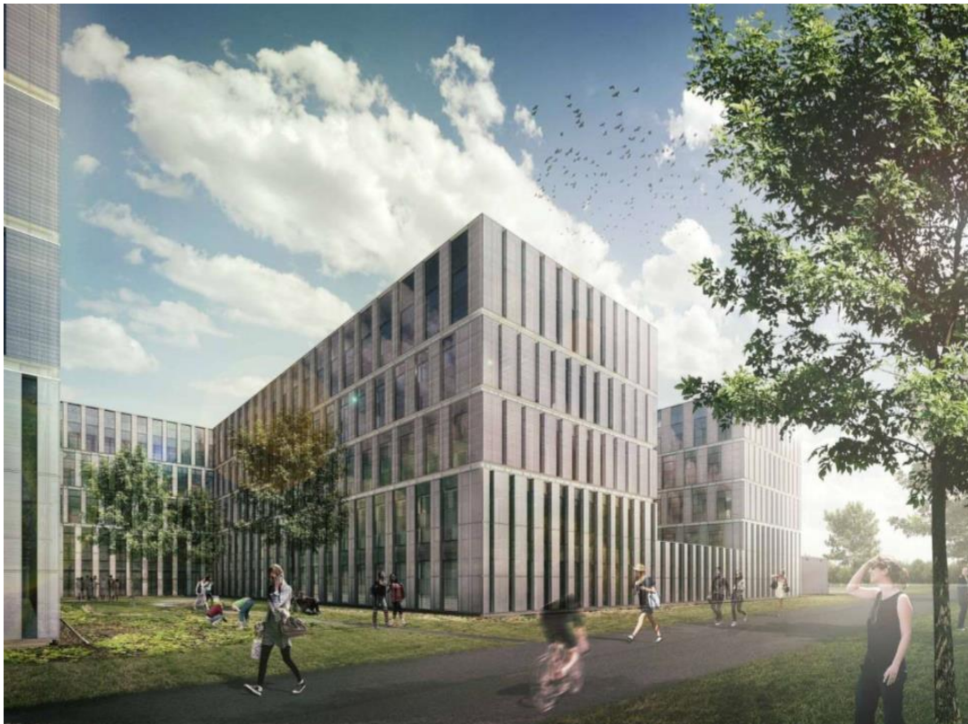
Afbeelding 2: impressie nieuwbouw

Op het gebied van duurzaamheid is een van de doelstellingen van de universiteit om het project BREEAM-gecertificeerd te krijgen. Ambitie is daarbij BREEAM-excellent. Voor de uitvoerende partijen zal dat betekenen dat zij tijdens de uitvoering uiteenlopend bewijsmateriaal zullen moeten aanleveren, waardoor ook de directievoering/het kwaliteitsmanagement te maken zal krijgen met aspecten op het gebied van BREEAM. Los daarvan is door de universiteit een BREEAM-coördinator aangesteld die belast is met de algehele coördinatie ten aanzien van het certificeringstraject.