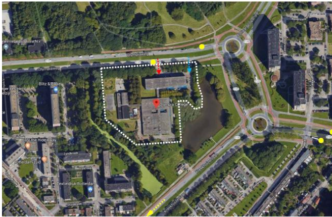
Figuur 1: Locatie Olympia College