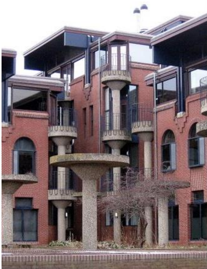
Afbeelding 2: impressie Cluster Zuid huidige situatie

Architect Joop van Stigt ontwierp de gebouwen aan weerszijden van de universiteitsbibliotheek van architect Bart van Kasteel. Cluster Zuid is het meest zuidelijke van de twee gebouwen. De totale lengtemaat van het terrein langs de Maliebaan (ca. 260 meter lang) vroeg volgens Van Stigt om een aantal 'intervallen' in de vorm van pleinen. Zo ontstond op een reeks constructies (met een stramienmaat van 7,20 meter) die in wezen als één geheel beschouwd kon worden. De gebouwen hebben gemiddeld drie verdiepingen boven een kelder met parkeervoorzieningen. De gebouwen worden gedragen door een constructie van paddenstoelkolommen op de stramienmaat van 7.20 meter. De expressieve kolommen zijn gedeeltelijk wel en gedeeltelijk niet in de gevel zichtbaar gemaakt en zorgen voor de ritmiek in het gevelbeeld. Met de rode bakstenen gevels (geïnspireerd door de baksteenarchitectuur van de Amsterdamse School) en de gevelindeling zocht Van Stigt aansluiting op de woonhuizen langs de Witte Singel. De opvallende houten dak overstekken en de balkons op de paddenstoelkolommen begeleiden de overgang van binnen naar buiten en verbinden tevens de werkplekken met de straten, pleinen en het water van de singel en de weer open gegraven trekvaart langs de Maliebaan.