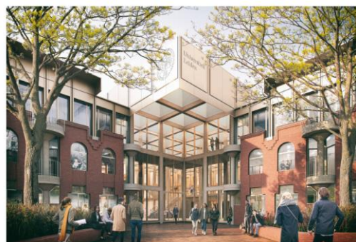
Impressie vanaf Nieuwe Entree