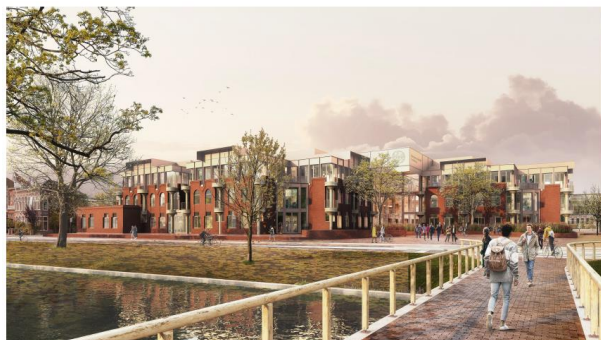
Impressie vanaf Paterbrug

Onderstaande afbeeldingen geven een impressie van het nieuwe bouwvolume.