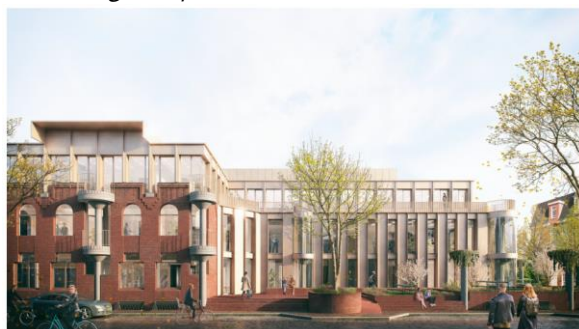
Impressie vanaf Maliebaan