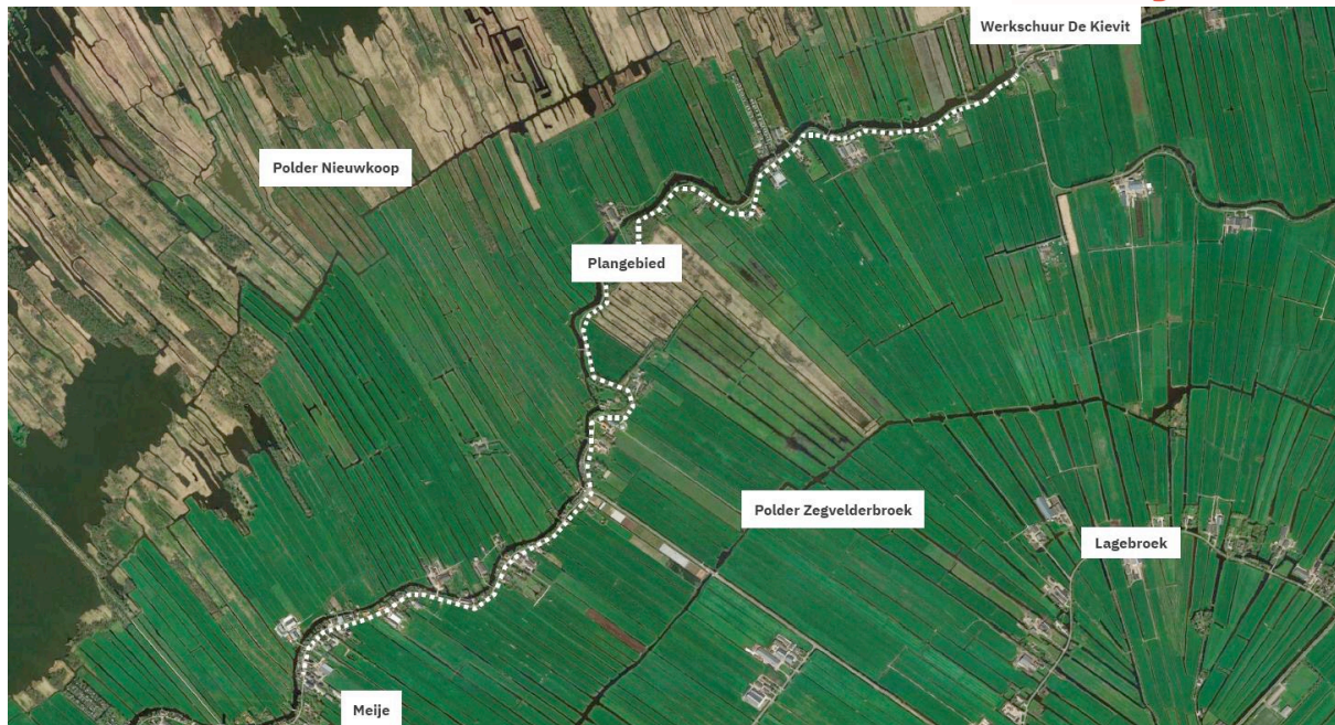
Figuur 1.1: overzicht projectgebied