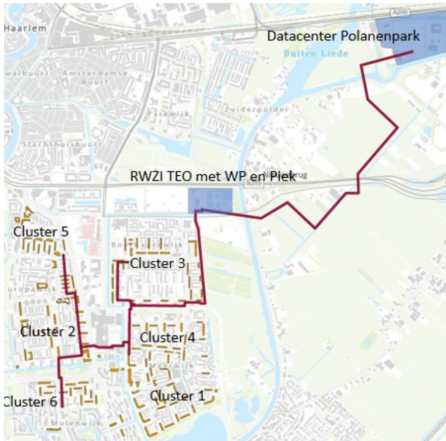
Figuur 1; voorlopige clusters vastgoed en voorziene locaties bronnen