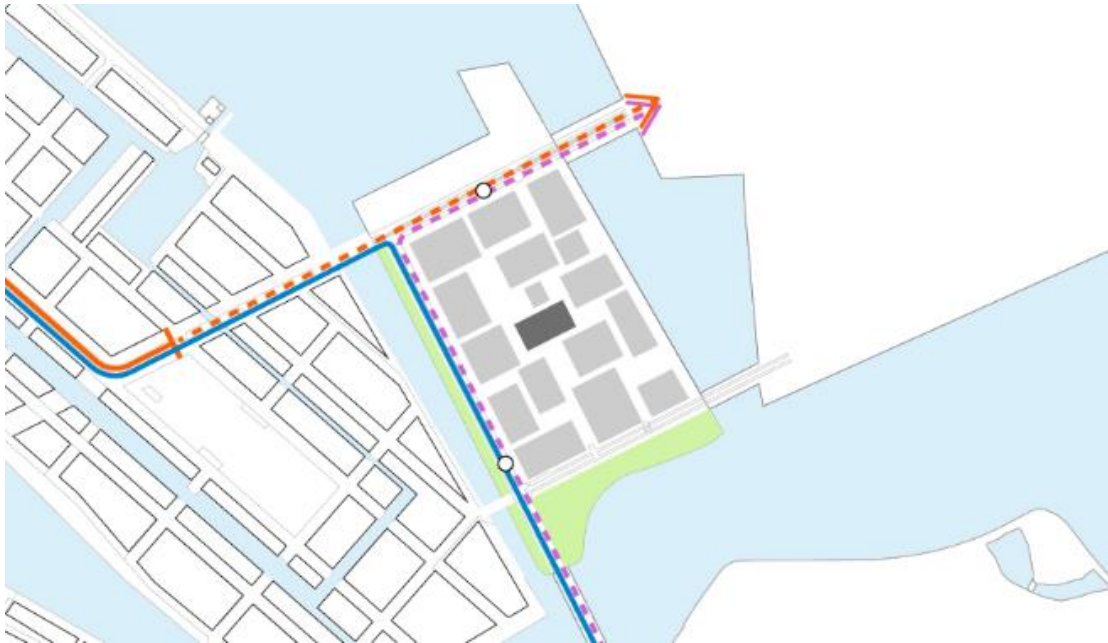
(Toekomstige) connecties openbaar vervoer. Tram 26 in rood. Busverbinding in blauw.

Er is minder ruimte voor de auto. Wel zijn alle blokken bereikbaar voor auto's en fietsers en toegankelijk voor kinderwagens en rolstoelen. De ontsluiting voor de auto bevindt zich aan de zuidzijde aan de Strandeilandlaan en aan de noordzijde aan de Pampuslaan. Ruimtes waar de auto niet vanwege de ontsluiting van het eiland hoeft te komen, worden ingericht als voetgangersgebied.