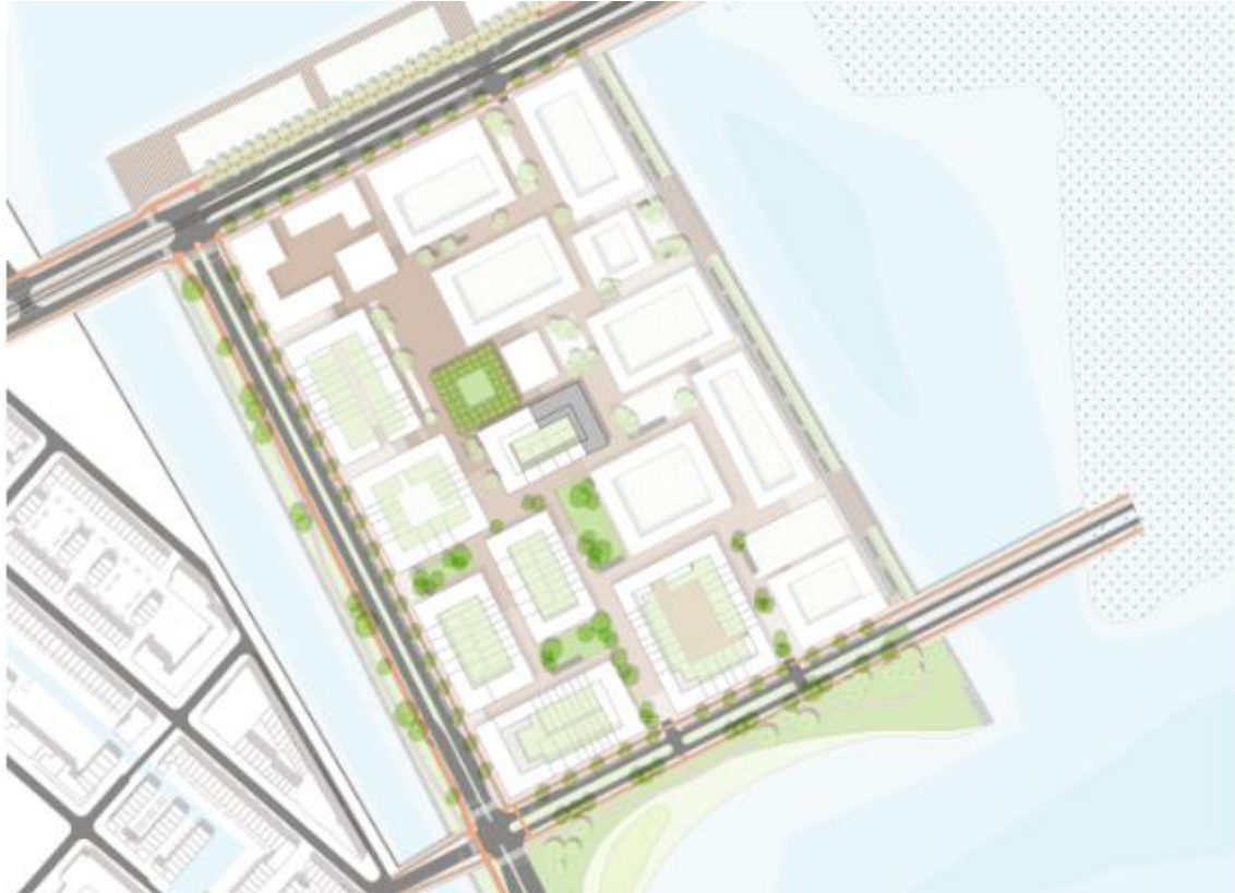
Ligging Kavel 8-02 op Centumeiland (grijs)

Belangrijk bij dit uitgangspunt is goede bereikbaarheid met openbaar vervoer. Er is een reservering voor een halte voor de IJtram, tram 26, bij de ontsluiting op de Pampuslaan. De lijn zal doorgetrokken worden vanaf het Haveneiland afhankelijk van de voortgang van de ontwikkeling op het Middeneiland. Deze zal naar verwachting in 2023 gereed zijn. Tot die tijd is buslijn 66 (richting Zuidoost) met een halte op de Muiderlaan de enige OV-lijn. Op de Pampuslaan ligt de reservering voor een tweede hoogwaardige OV-lijn tussen Zuidoost en het Middeneiland. Daarnaast is het faciliteren van de fiets en de voetganger een belangrijk onderdeel van het plan.