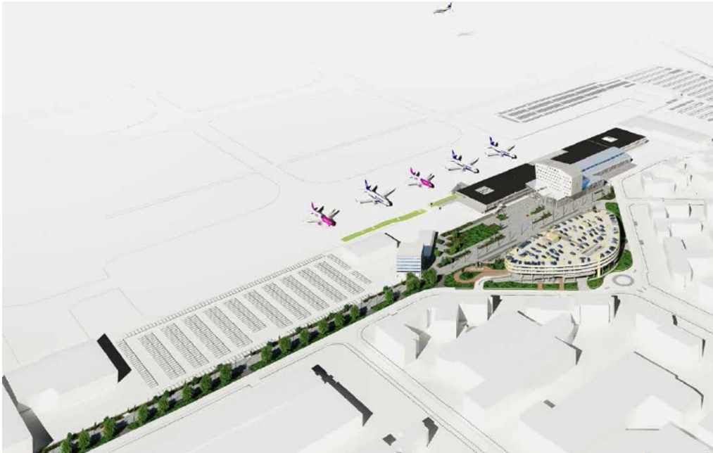
Figuur 1. Visualisatie van de herinrichting van het buitenterrein