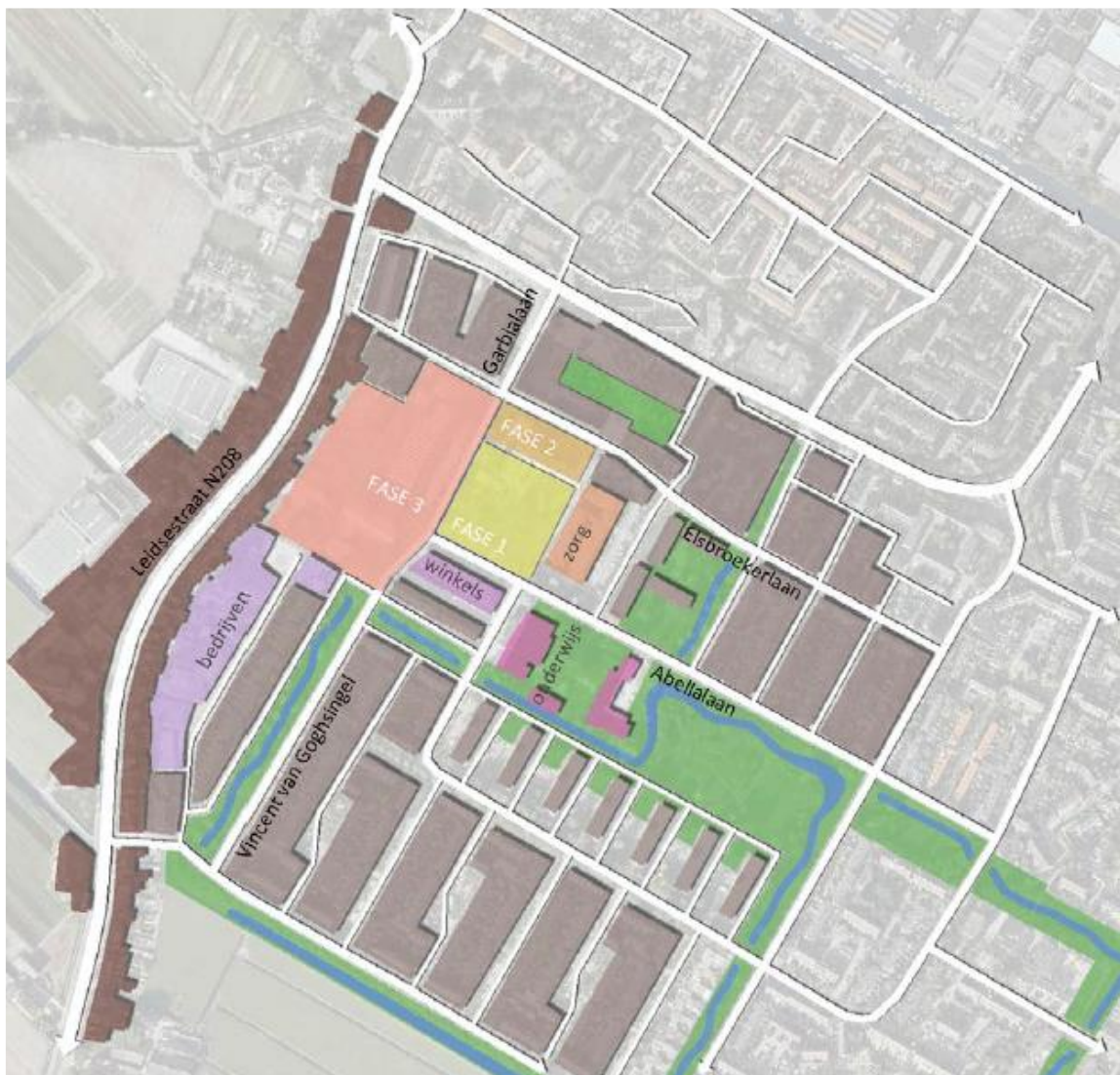
Figuur 2: Context Woonzorgzone Elsbroek, planfasen 1, 2, 3