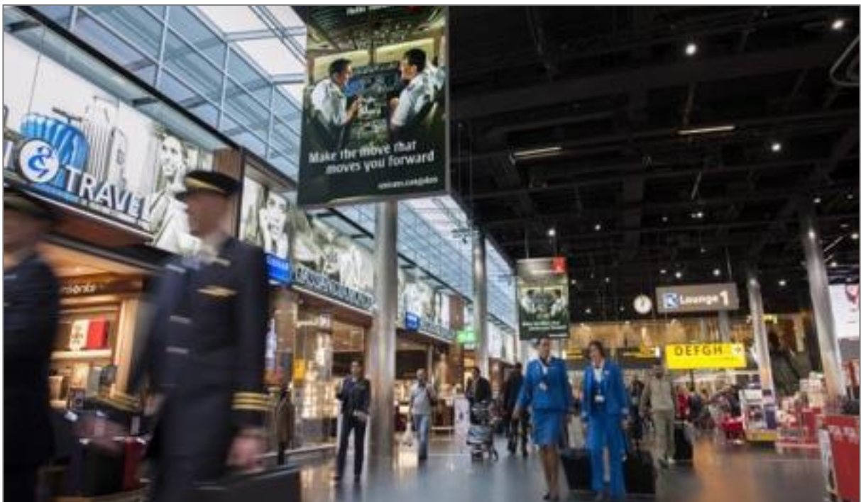
Figuren 1 en 2: impressies van de huidige Lounge 1.