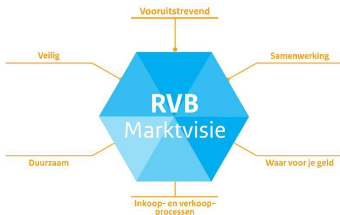
Figuur - speerpunten RVB Marktvisie

Door duidelijk aan te geven met welke bedrijfsprocessen het Rijksvastgoedbedrijf de samenwerking zoekt met Opdrachtnemer wordt met de invulling van de samenwerkruimte helder waar verantwoordelijkheden belegd zijn. Samenwerking is een overkoepelend speerpunt uit de RVB Marktvisie, waarbij afspraken gemaakt worden over samenwerken en wordt vastgelegd.