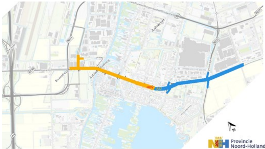
Afbeelding 1 Overzicht projectgebied HOVASZ