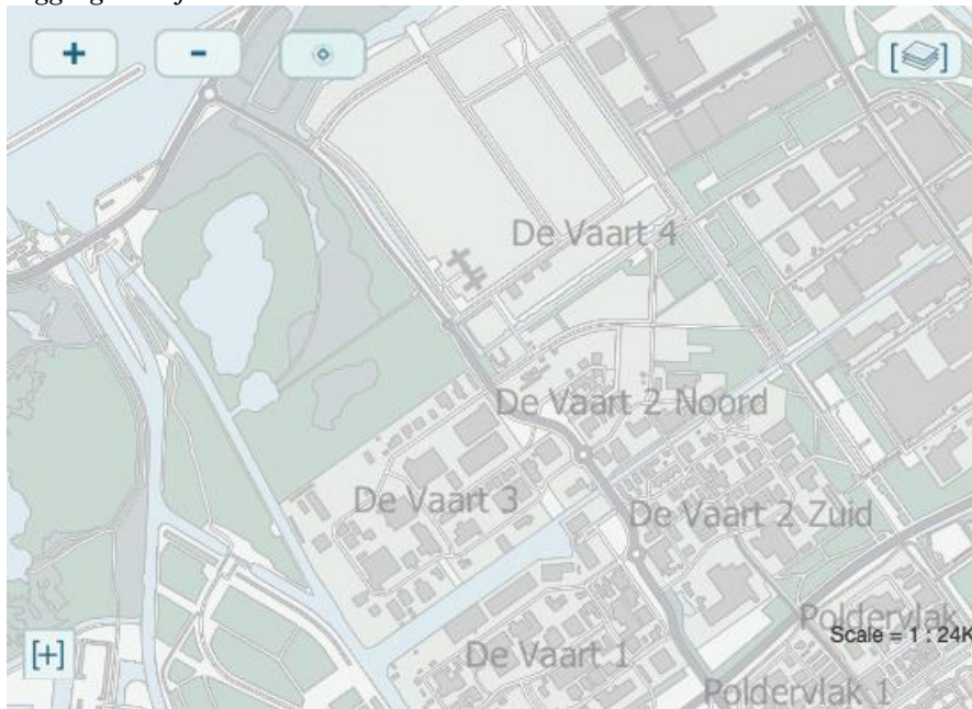
Ligging bedrijventerrein De Vaart 4

In de rapportage 'Zonnevelden in Almere' (2015) zijn de gebieden de Vaart 4 en Stichtsekant aangewezen als geschikte plekken voor de realisatie en exploitatie van zonneparken op gemeentegrond. De gronden zijn gemeentelijk eigendom en de betreffende percelen zullen voorlopig niet in gebruik worden genomen. Er is besloten om met één locatie te starten. Daarvoor komt bedrijventerrein de Vaart 4 nu als meest aantrekkelijk naar voren. Het betreft een perceel van circa 25 hectare.